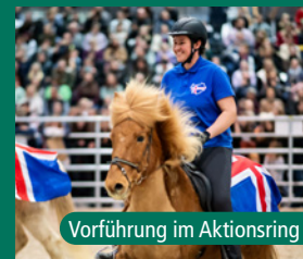
Vorführung im Aktionsring